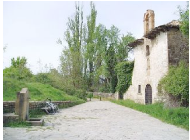
San Cristóbal Hermitage