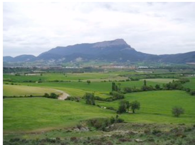
Port of Borau